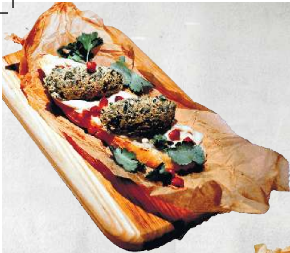
ПХАЛИ С ЗЕЛеноЙ ФАСОЛЮ BRUSCHETA PHALI GREEN BEANS