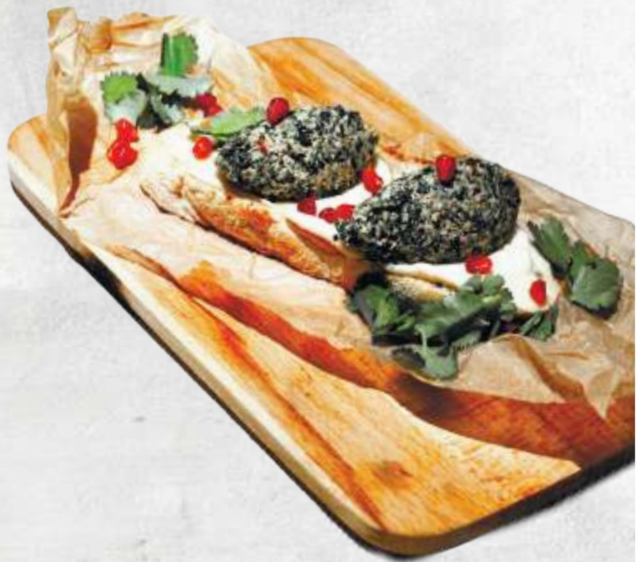
ПХАЛИ СО СВЕКЛОЙ BRUSCHETA PHALI BEETROOT