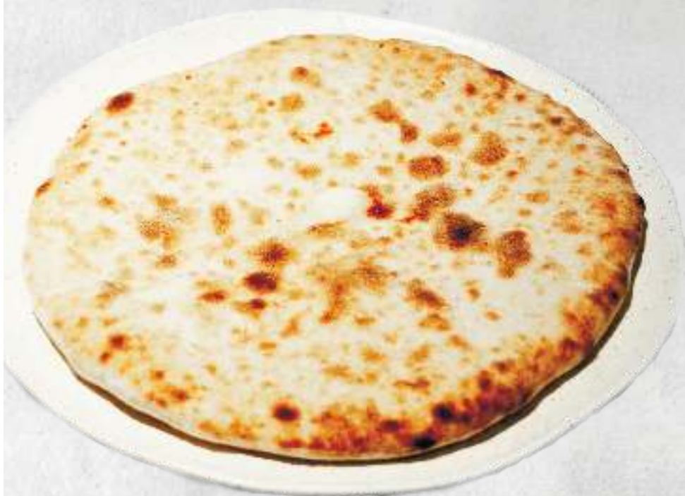
ХАЧАПУРИ ИМЕРЕТИНСКИЕ KHACHAPURI IMERETI