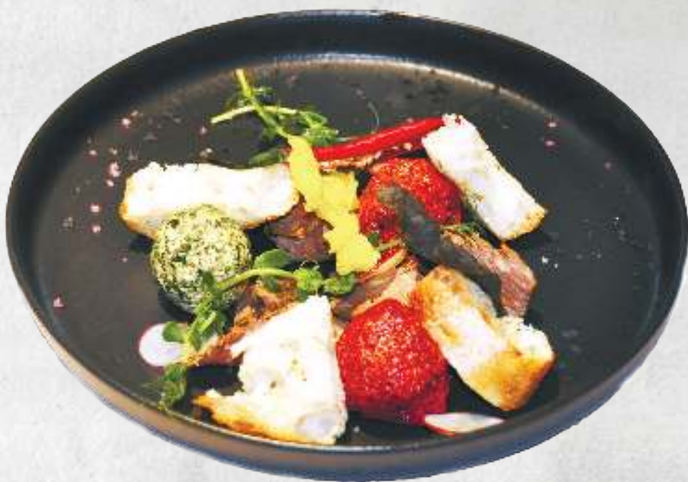
ЗАКУСКА ПХАЛИ С РОСТБИФОМ PHALI APPETIZER WITH ROAST BEEF