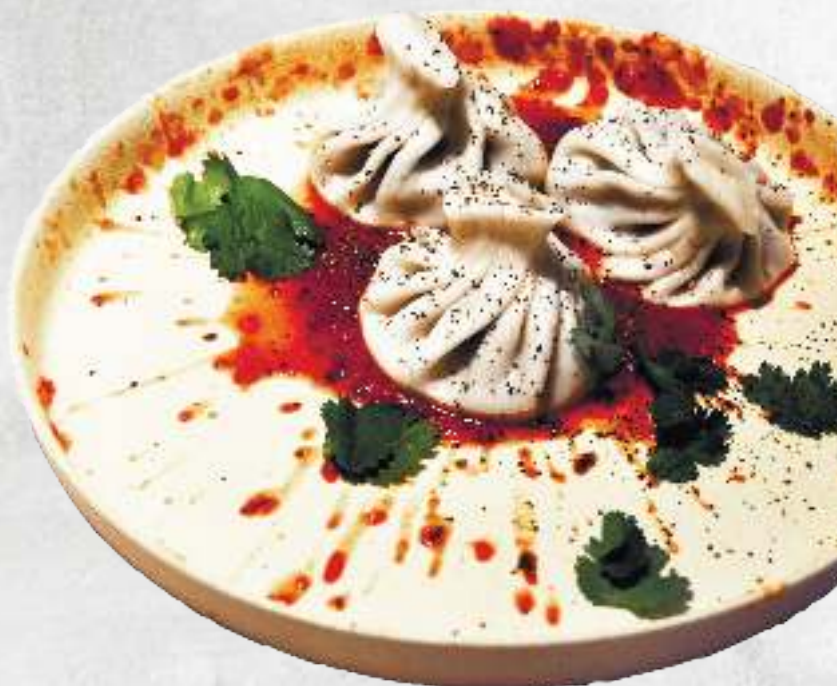
ХИНКАЛИ СВИНИНА + ГОВЯДИНА KHINKALI WITH PORK AND BEEF