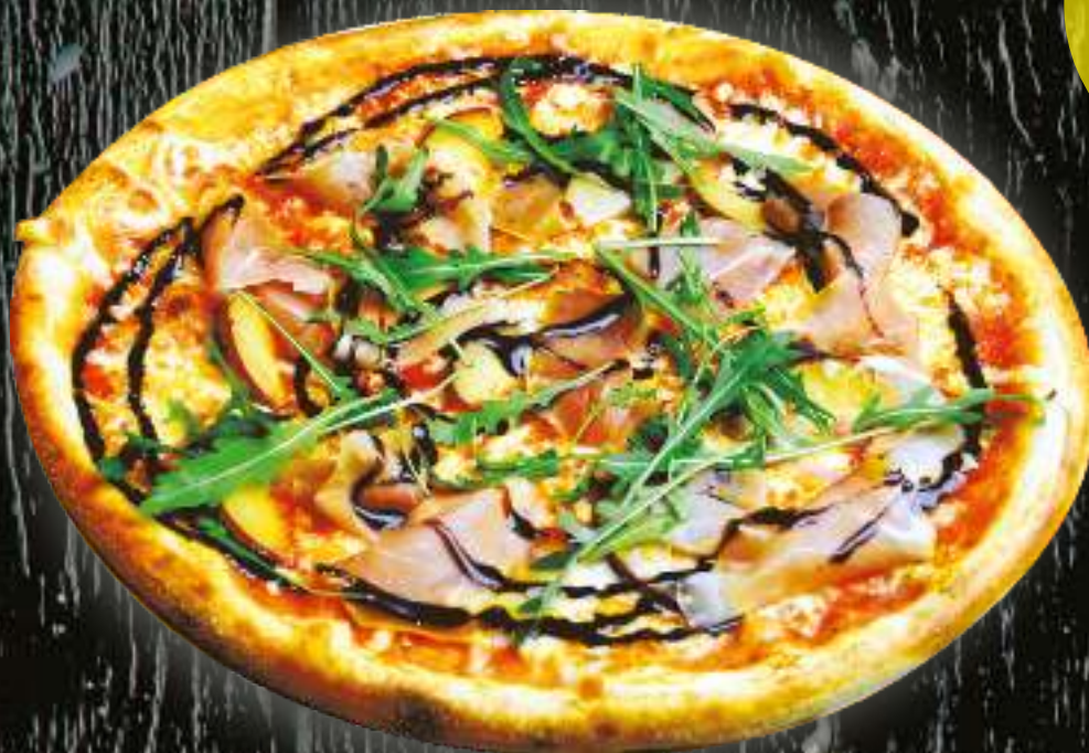
Пицца с пармской ветчиной Pizza with parma