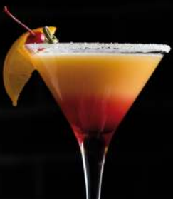
СЕКС НА ПЛЯЖЕ

Водка Морс Персиковый ликер Апельсиновый сок