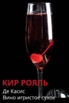
КИР РОЯЛЬ Де Касис Вино игристое сухое